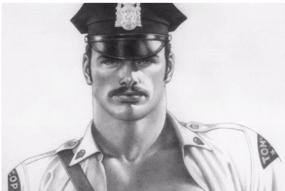
Tom of Finland de Dome Karukoski. Finlandia, 2017.