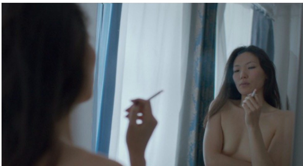
Don't Look at Me That Way de Uisenma Borchu. Alemania / Mongolia, 2015.