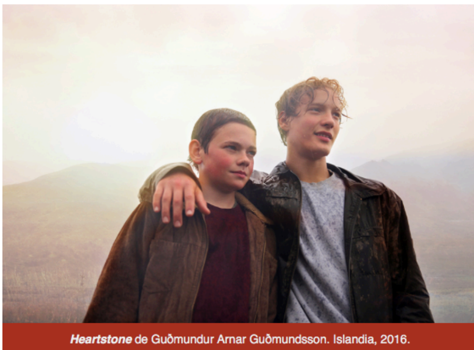
Heartstone de Guðmundur Arnar Guðmundsson. Islandia, 2016.